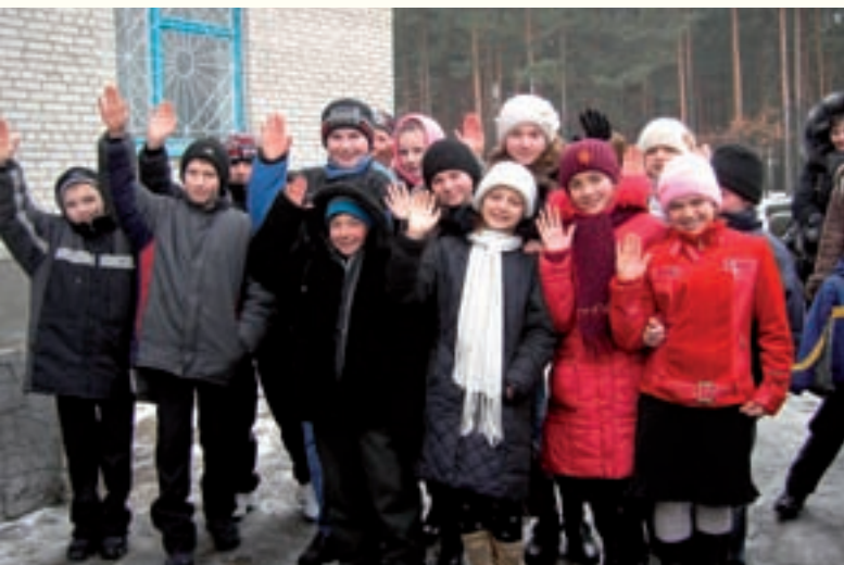
Glada tjernobylobarn med minnen från sommarlägret i Malmö.