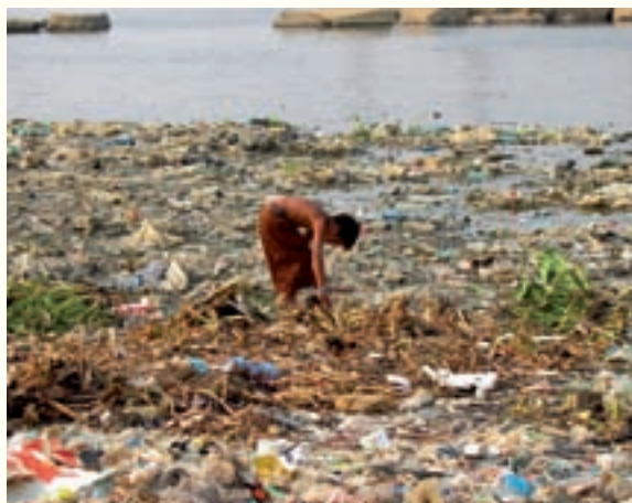
En pojke som letar bland soporna efter något att sälja.

Molfrid Center är medelpunkten i Payatas "Smokey Valley", den stora soptippen i Manila. Här finns förskola, syskola, tandläkarklinik, körskola, datorskola och matprogram för behövande barn.