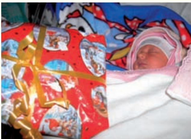
Genom vårt julprogram har hon fått sin första julklapp .

Vi har fortsatt vårt ekonomiska och materiella stöd till rehabiliteringshemmet i Datschny. Även här har vi stor hjälp av Osbygemenskapen. Detta hem är inriktat mot funktionshindrade barn som behöver stimulans och träning. Det är underbart att se hur professionellt och med vilken inlevelse och kärlek personalen arbetar med barnen. Det som fattas är pengar till näringsriktig mat och rehabiliteringsutrustning. Här kan Barnmissionen göra en stor skillnad.