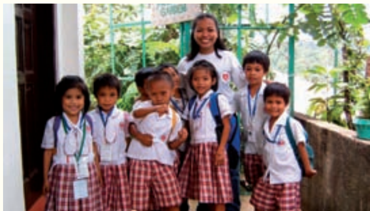
Skolbarn på Leto Christian Center.

Vår granne har byggt en skyskrapa vägg i vägg med oss och den stod färdig 2007. Vi har haft många problem med detta bygge eftersom vår byggnad fick sättningar och vattenavrinningen från skyskrapan hamnade på vår tomt. Dessa problem avhjälpes under året och byggfirman stod för alla kostnader. Vårt bageri har kommit i full sving 2007 och nu gör vi alla brödprodukter själva till våra hjälpprogram.