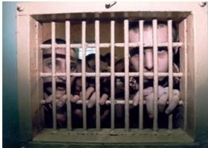
Barnmissionen har ett stort arbete på barn och ungdomsfängelser.

Vi arbetar i fängelset Sokal som hyser landets tyngst kriminellt belastade interner, pojkfängelser i Kovel och i Dubno samt flickfängelset i Melitopol. Tillsammans med de lokala församlingarna bedriver vi kontinuerlig bibelundervisning och vi har tre anställda evangelister som sköter detta arbete. Vi har även ett rehabiliteringscenter för före detta fångar i Sokal. Under 2007 köpte vi in en ny tomt i Sokal där vi skall bygga ett nytt rehabiliteringscenter för utsläppta fångar och gatubarn. Detta center bygger vi tillsammans med pingstkyrkan i Sokal. Vi hjälper också fångelserna med humanitär hjälp som i huvudsak kommer från Svenska Försvarsmakten.