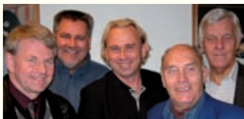
Skandinaviska Barnmissionens styrelse.