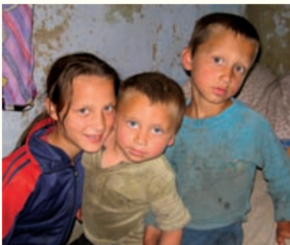
I Moldavien finns det många barn som behöver vår hjälp.

2007 firade Skandinaviska Barnmissionen 15-års jubileum i Ukraina. Vi anordnade en jubileumsresa och hade räknat med att cirka 60 personer skulle anmäla sig. Responen blev över all förväntan och vi blev 140 personer som reste ner till Ukraina. Logistiskt var detta en stor utmaning för Skandinaviska Barnmissionen, både i Sverige och i Ukraina. Resan blev en fantastisk succé och resenärerna var oerhört imponerade över hela vårt arbete. Allt avslutades med en enorm tillställning på stadsteatern i Lutsk där 680 olika artister och dansare ställde upp gratis i en sex timmar lång hyllning till Skandinaviska Barnmissionen. Myndighetspersoner, församlingsledare, politiker, NGO:s och människor som fått hjälp kom för att ge sitt tack till missionen. Vi minns alla varma långa tal, en iskall teater och oerhört professionella artister. Hela jubileet hette "Gud är trofast" och det var något som genomsyrade allt som sades och upplevdes under vår vecka i Ukraina. Vår personal i både Sverige och Ukraina skall ha stor heder av att ha genomfört ett så stort arrangemang.