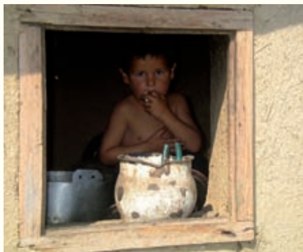
Många moldaviska föräldrar arbetar utomlands och barnen lämnas ensamma hemma.

Till jul gjorde vi en stor satsning där vi kopierade konceptet att dela ut matpaket till fattiga människor från det ukrainska arbetet. Vi delade ut 200 matpaket på 15 kg vardera och det var en stor uppgift för en liten församling men de skötte uppgiften galant. Den ekonomiska redovisningen var detaljerad och uppfyllde våra krav.