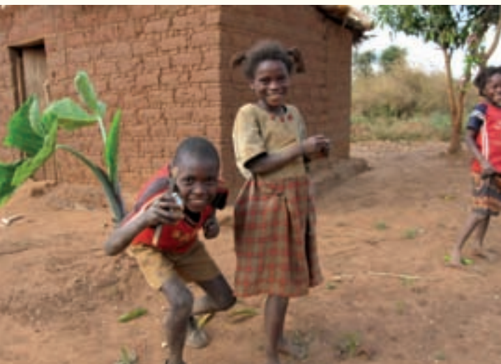
Trots svåra levnadsförhållanden finns det utrymme för glädje och lek.