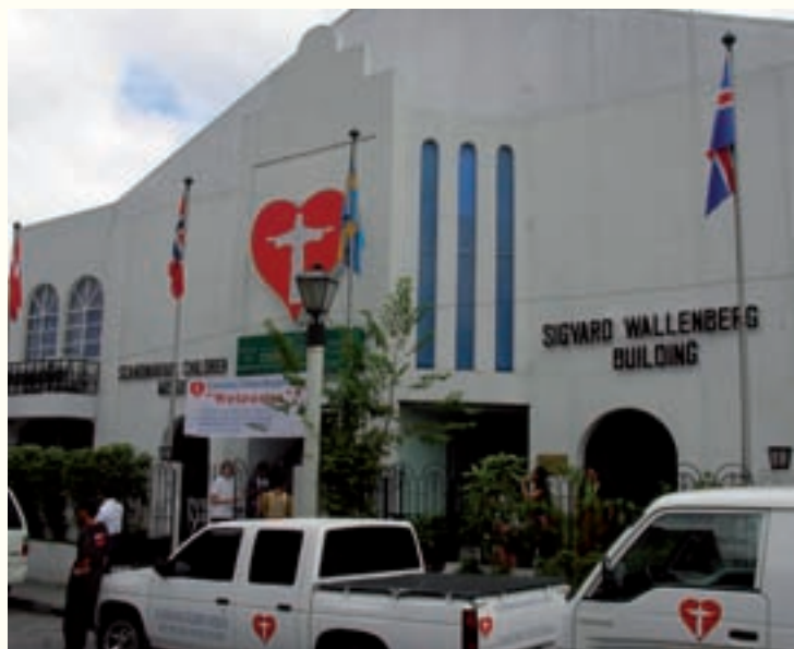
Skandinaviska Barnmissionens huvudbyggnad Sigvard Wallenberg Building.

Församlingen har fått en nytändning, speciellt i sitt ungdomsarbete. Vi ser hur en självständig församling växer fram med ungdomlig inspiration. Thord har varit ett bra stöd för pastorer och ledare. Vi för också ett nära samarbete med församlingen då de hjälper oss med evangelisation i vårt missionsarbete.